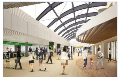
〈松戸駅改良工事イメージ図〉