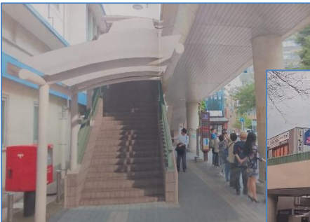
〈北小金駅の屋根計画図〉

長年要望事項であった、北小金駅南口に上がる階段上に屋根が設置されます。また、ホームにはホームドアが設置されます。バリアフリーの便利な駅になります。ホームドアに関しては、北小金駅だけでなく、J R 各駅で設置工事が進んでいます。松戸駅は、東西通路の拡幅、改札内コンコースの拡張、中央改札の統合、上野方面に6階建ての駅ビルが建設されます。